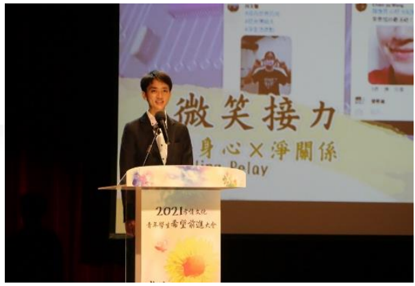
青年力典範 及 和平設計師示範