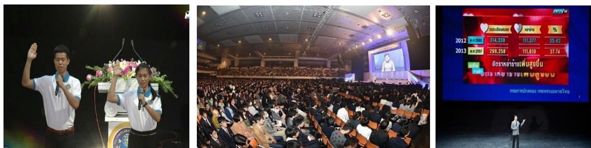
世界和平青年學生聯合會 泰國萬人大會