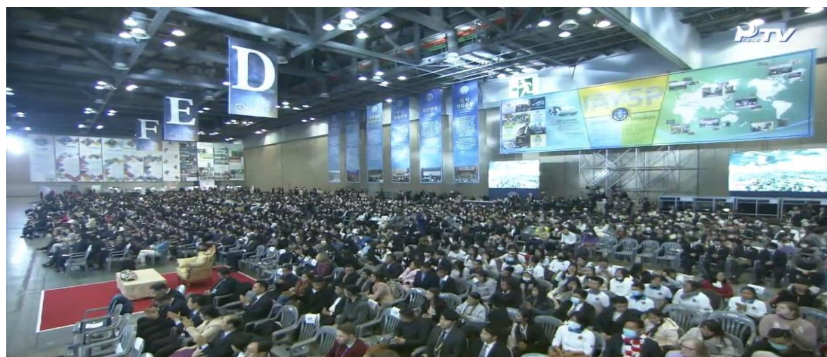
世界和平青年學生聯合會 韓國萬人大會