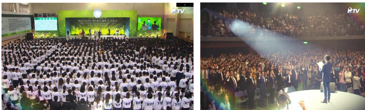
2017 世界和平青年學生聯合會 成立大會