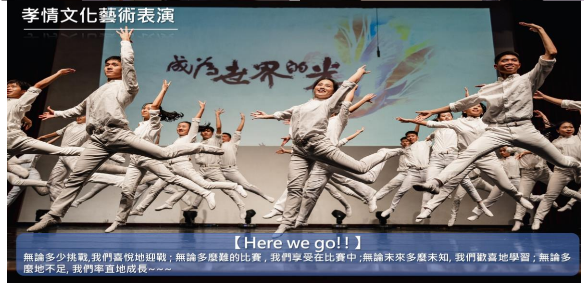
孝情文化藝術表演